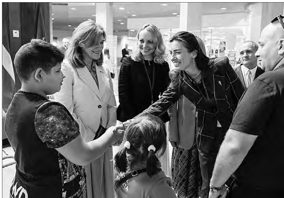
Марія Мезенцева потискає руку хлопчику, який брав участь у відкритті виставки, ліворуч від неї віце-президентка ПАРЄ, народна депутатка України Олена Хоменко та Занда Калніня-Лукашевиця.

«Ця виставка — не лише про малюнки та історії дітей, які возз'єдналися зі своїми сім'ями. Це величезний біль, який ми відчуваємо в наших серцях за багато тисяч українців, що продовжують шукати своїх близьких», — розповіла Марія Мезенцева. — Проголосувавши в ПАРЄ за резолюцію на весні цього року та визнавши, що примусове переміщення українських дітей до рф відповідає ознакам геноциду, ми створили величезний міжнародний прецедент, якому варто слідувати. На жаль, наразі не існує єдиного механізму повернення депортованих дітей додому, до їхніх сімей та опікунів. Тому сьогодні, завтра і щодня