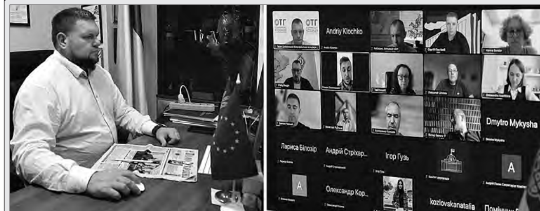
Більше фото тут — www.golos.com.ua

Член Комітету Верховної Ради України з питань організації державної влади, місцевого самоврядування, регіонального розвитку та містобудування Андрій Ключко під час засідання комітету, на якому було розглянуто пропозиції до другого читання проекту закону України «Про внесення змін до розділу VI Бюджетного кодексу України щодо забезпечення підтримки обороноздатності держави та розвитку оборонно-промислового комплексу України».